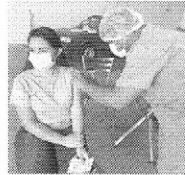
Funcionários do Reviver também foram imunizados