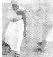
Grupo prioritário foram autorizados a receber a vacina

Consórcio Intermunicipal do Alto Vale do Paranapanema - AMVAPA Rua Capão Reviver, nº 100 - Centro - Sarutaia - SP - CEP: 13470-000 - Fone: (14) 3762-2187 E-mail: contato@amvapa.com.br