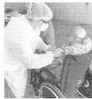
Idosos foram vacinados nesta semana