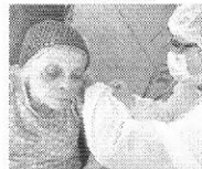
Idosos da Fundação foram imunizados contra a covid-19